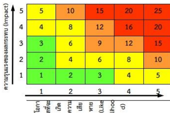
ตารางระดับของความเสียหาย (Degree of Risk)